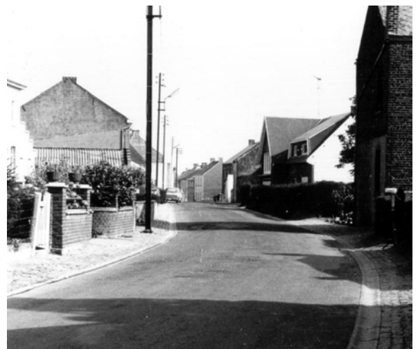
Encore peu de voitures dans les années '70

A la fusion des communes, le 1 er janvier 1977, la nouvelle entité comptait trois rues du Mont. Pour réduire au maximum les changements d'adresse, ce sont celles des villages, moins peuplées, qui furent rebaptisées en séance du conseil communal du 20 septembre 1977, respectivement rue des Saules à Thorembais-Saint-Trond, rue du Béguinage et rue du Mayor Severin à Thorembais-les-Béguines.