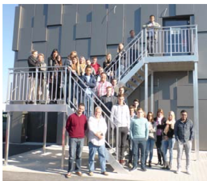
La rentrée des futurs agents immobiliers